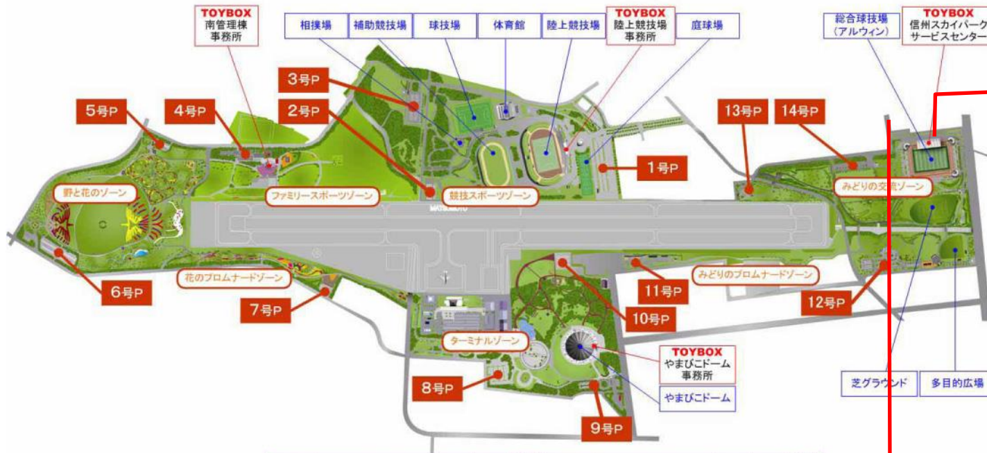
信州スカイパーク 駐車場案内図